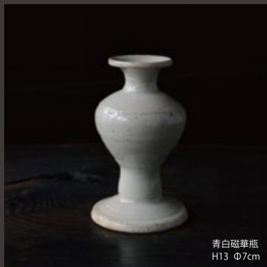
青白磁華瓶 H13 Φ7cm