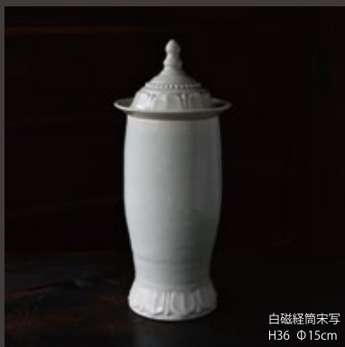
白磁経筒宋写 H36 Φ15cm