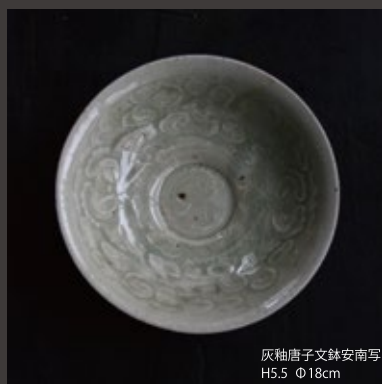
灰釉唐子文鉢安南写 H5.5 Φ18cm