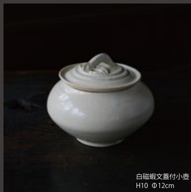
白磁蝦文蓋付小壺 H10 Φ12cm