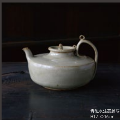
青磁水注高麗写 H12 Φ16cm