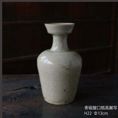
青磁盤口瓶高麗写 H22 Φ13cm