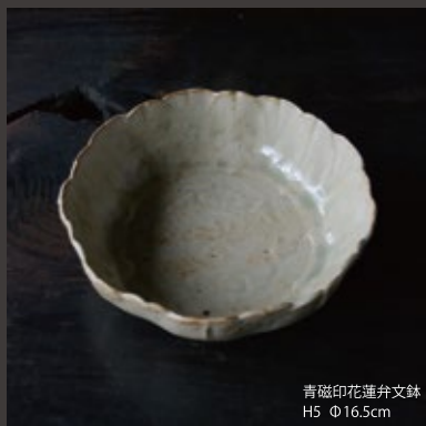
青磁印花蓮弁文鉢 H5 Φ16.5cm