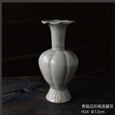
青磁瓜形瓶高麗写 H24 Φ12cm