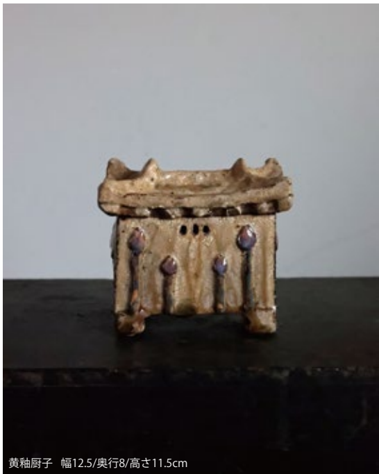
黄釉厨子 幅12.5/奥行8/高さ11.5cm