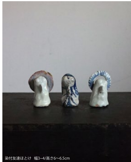
染付友達ほけ 幅3~4/高さ6~6.5cm