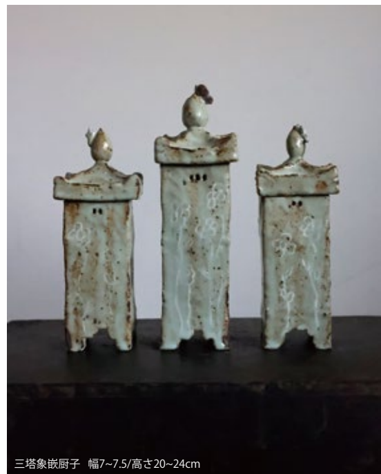
三塔象嵌厨子 幅7~7.5/高さ20~24cm