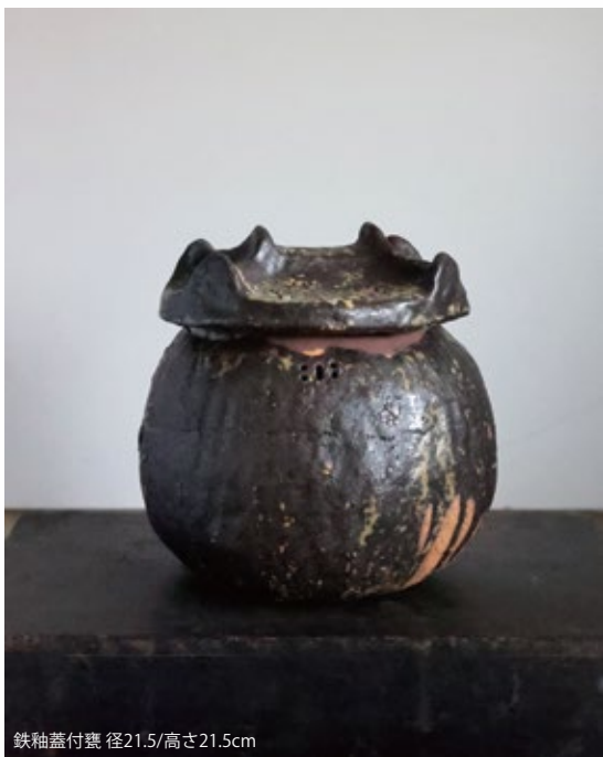
鉄釉蓋付壺 径21.5/高さ21.5cm