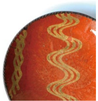
米国スリップウェア