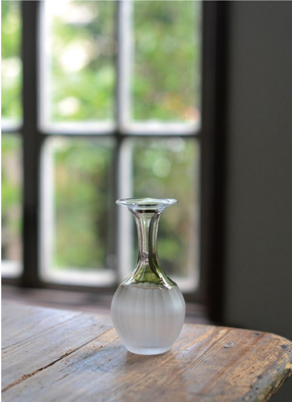
目片千恵 ガラス展 夏霞 (なつがすみ) 2019年7月20日(土)–28(日) 会期中無休