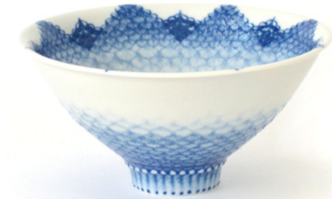
茶碗「露絲衣」 口径15.3cm 高さ7.4cm

1974年 石川県金沢市生まれ 1994年 デンマーク王国 Holbek美術国民学校 留学 1999年 石川県立九谷技術研究所 修了 2012年 伝統工芸士認定(九谷焼成形部門) 2016年 金沢美術工芸大学 美術工芸研究科 博士課程 修了 2019年 現在神戸芸術工科大学アートクラフト学科 准教授