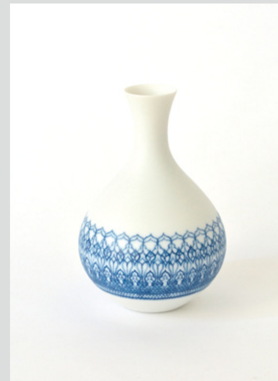
花器 高さ 14cm 胴径 9cm 本体 森岡希世子 絵付 澤谷由子