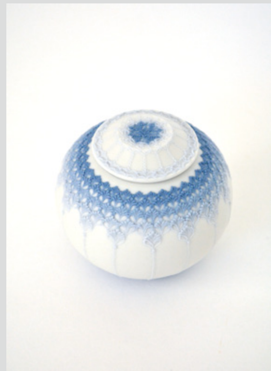
茶入 高さ 6.5cm 胴径 7cm 本体 森岡希世子 筒描 澤谷由子