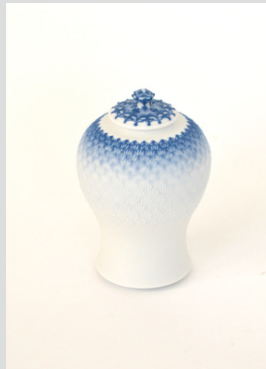
茶入 高さ 9cm 胴径 5.5cm 本体 森岡希世子 筒描 澤谷由子