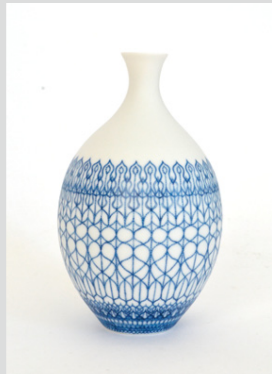
花器 高さ 15cm 胴径 8.5cm 本体 森岡希世子 絵付 澤谷由子