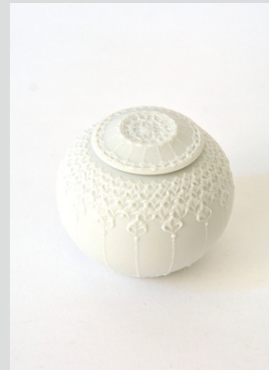
茶入 高さ 6cm 胴径 7cm 本体 森岡希世子 筒描 澤谷由子