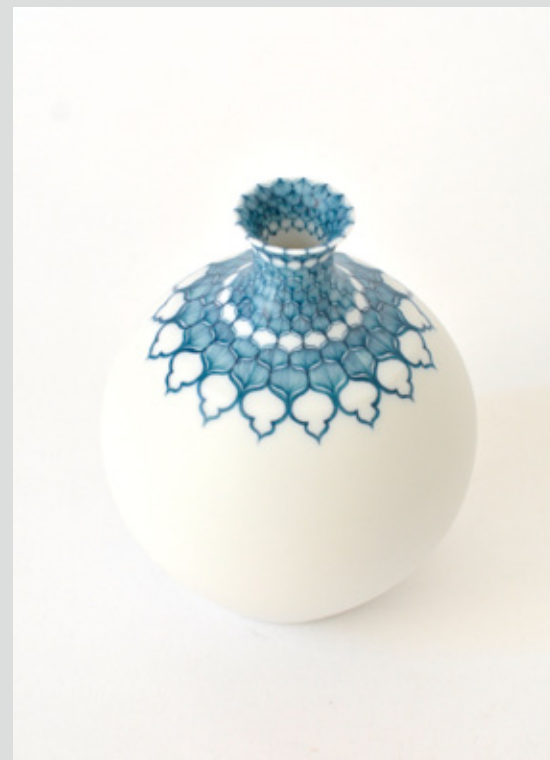
酒器 高さ 10cm 胴径 8cm 本体 森岡希世子 絵付 澤谷由子