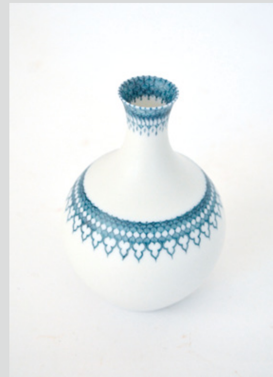
酒器 高さ 11cm 胴径 7cm 本体 森岡希世子 絵付 澤谷由子