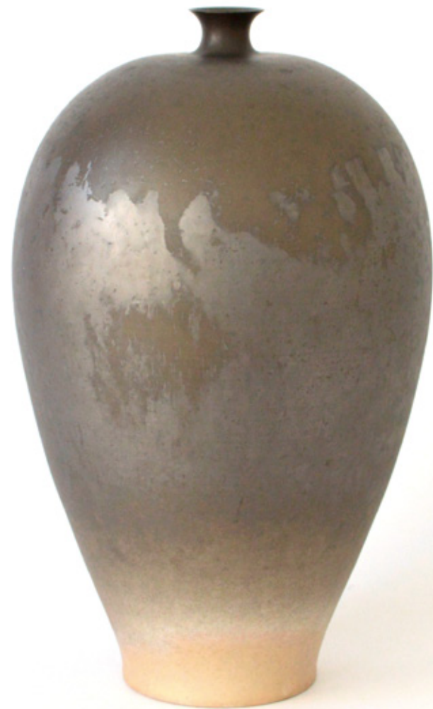
黒肩張壺 高さ28.2cm 胴径16cm

二〇一九年四月六日(土)～十四日(日) 会期中無休 営業時間 十一時～十八時 作家在廊日 四月六日(澤谷・七日(澤谷・森岡))