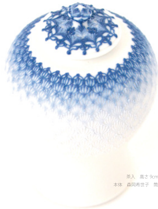
茶入 高さ9cm 胴径5.5cm 本体 森岡希世子 筒描 澤谷由子

電車：川越駅(東武東上線・JR)より徒歩25分 本川越駅(西武新宿線)より徒歩20分 バス：駅東口3番乗場 [小江戸名所めぐり]～[喜多院前] 駅西口2番乗場 [小江戸巡回バス]～[喜多院] 車：ギャラリー専用駐車場3台分有