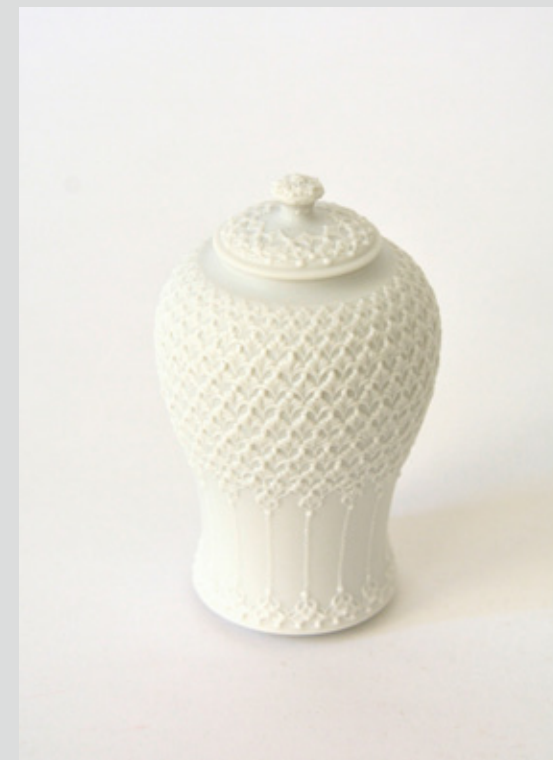
茶入 高さ 9.5cm 胴径 5.2cm 本体 森岡希世子 筒描 澤谷由子