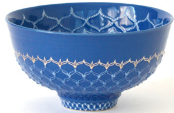
茶碗「露鎖」 口径12cm 高さ6.3cm