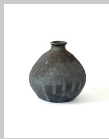
瓶小壺 胴径17 高さ18cm