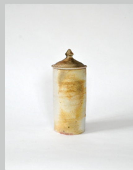
瓶小壺 胴径11 高さ28cm