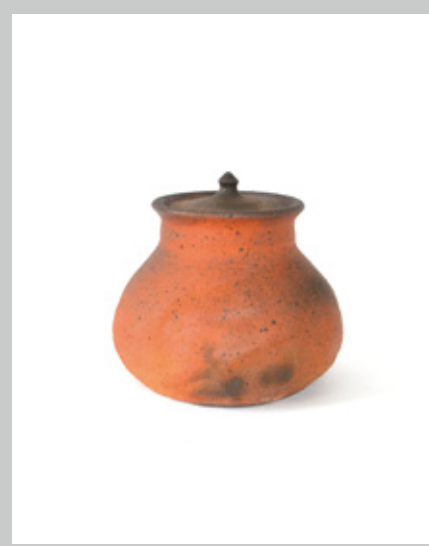
瓶小壺 胴径22 高さ20cm