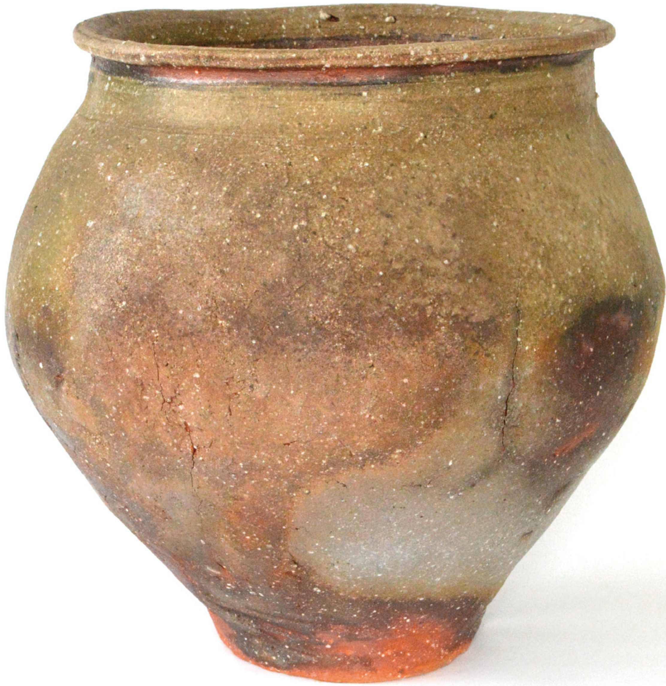
瓶大壺 胴径41 高さ42cm