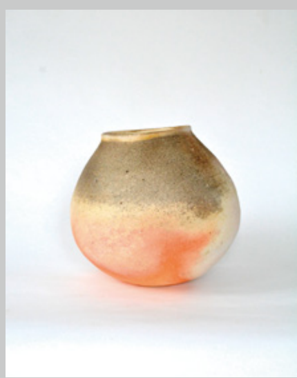
瓶小壺 胴径30 高さ30cm

電車：川越駅(東武東上線・西武池袋線)より徒歩25分 バス：家東(3番乗場)小江戸名所めぐりー[喜多院前] 駅西口2番乗場(小江戸名所めぐりー[喜多院前]) 車：ギャラリー専用の新駐車場は北側(5～8番)