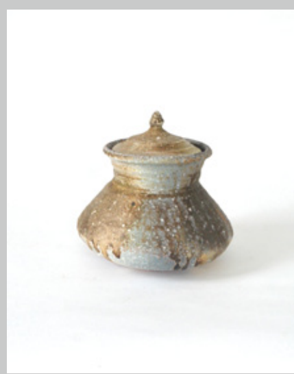
瓶小壺 胴径21 高さ20cm