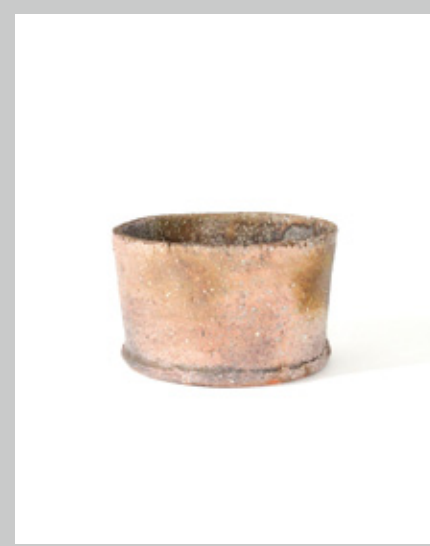
鉢丸碗 口径19 高さ11cm