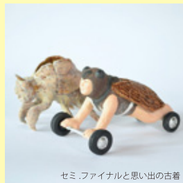
セミ・ファイナルと思い出の古着