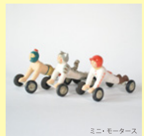
ミニ・モーターズ