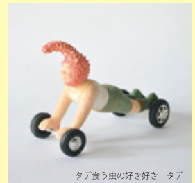
タテ食う虫の好き好き タテ