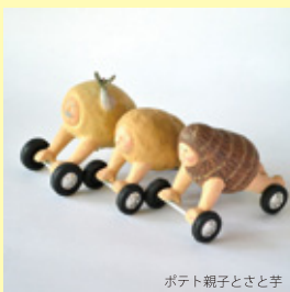
ポテト親子とさと芋