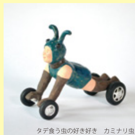
タテ食う虫の好き好き カミナリ虫