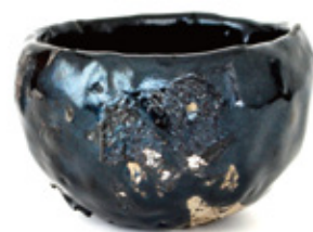
八坂土引出黒茶碗