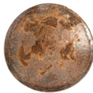
馬町土貝目銀彩平茶盃