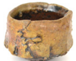
馬町土鍋焼締ぐい呑