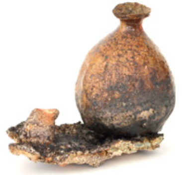
馬町土窯付焼締一輪挿