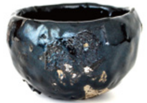
八坂土引出黒茶碗