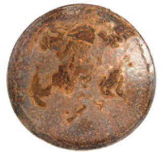
馬町土貝目銀彩平茶盃