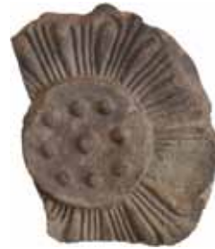
西安寺瓦 (白鳳時代) 三坂堂