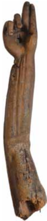
磔刑像の右手 (仏15世紀) titcoRet