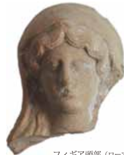
フィギア頭部 (ローマ時代) Sundries