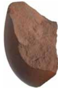
土器オブジェ 熊谷幸治