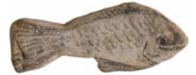
縄文中期石器 ブリキ星