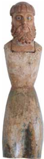
サントス像 (18世紀) 三坂堂