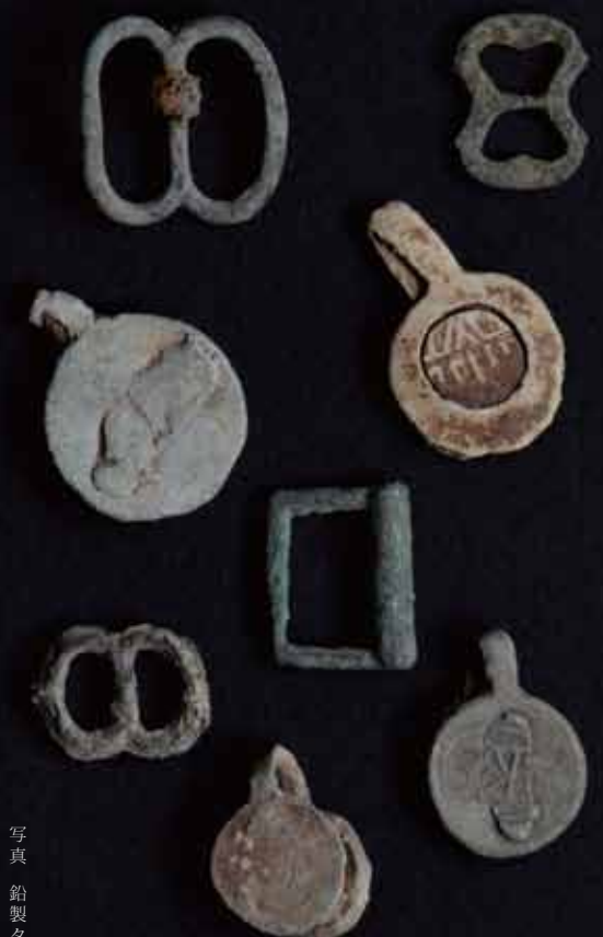
写真 鉛製タグと青銅バツクル