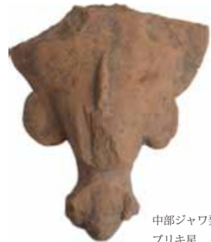
中部ジャワ発掘土偶 ブリキ星