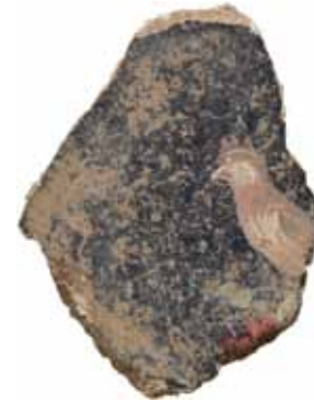
古代フレスコ画断片 (ローマ時代) Sundries